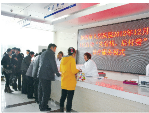
2012年12月1日启动“先看病 后付费”诊疗服务模式