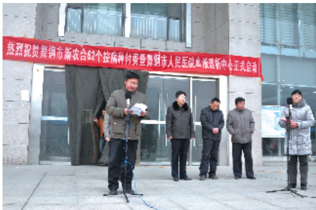
血液透析中心成立