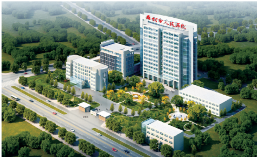
舞钢市人民医院效果图

慢性肾炎转为尿毒症之后,患者需要终身依靠透析维持生命,高昂的费用让很多农村患者为之咋舌,甚至放弃治疗。为了减轻尿毒症患者负担,舞钢市卫生局、市人民医院、新农合部门及民政局等部门多次协商,于2013年上半年,将舞钢市人民医院确定为新农合尿毒症患者救治试点医院,并在下半年开始实行“舞钢市新农合尿毒症患者优惠救治方案”,即