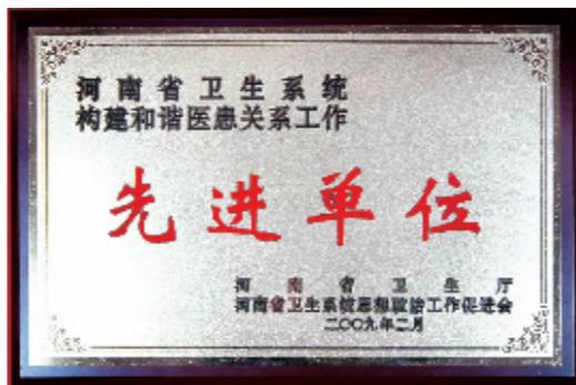
被评为构建和谐医患关系先进单位